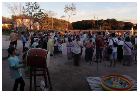
夏を締めくくる夕涼み会